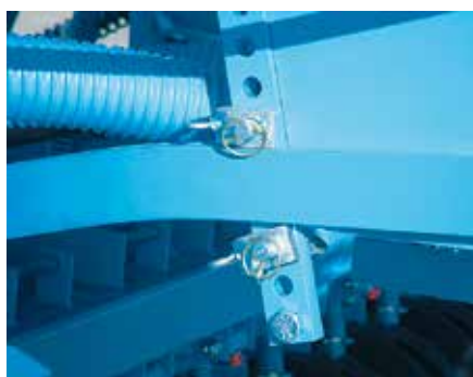
Регулировка давления сошников

Давление на сошники централизованно передается через прочный сошниковый брус.