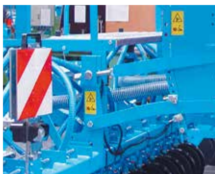
Регулировка глубины посева

Именно при изменяемых почвенных условиях независимая регулировка глубины высева и давления сошников является гарантией точного размещения семян.