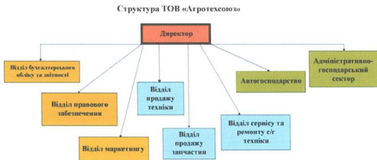
Малюнок 1. Організаційна структура ТОВ «АТС»