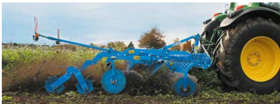
Сплошное и интенсивное перемешивание