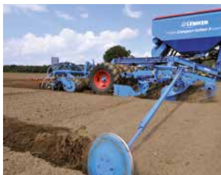
Маркер с болтовой защитой на срез

Гидравлические маркеры расположены спереди и поэтому всегда находятся в поле зрения водителя.