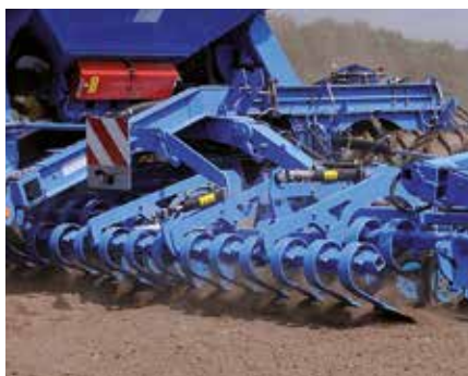
Подпружиненные выравнивающие стойки

При применении Компакт-Солитера по вспашке рекомендуется использовать гидравлически регулируемые выравнивающие стойки.