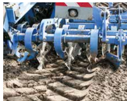
Диски для следорыхления

На легких и рыхлых почвах рекомендуется использовать рабочие органы для рыхления следов транспортного средства. Диски для следорыхления для всех складываемых комбинаций Compact-Solitair позволяют надежно убрать все следы от колес.