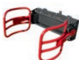
C 40 1