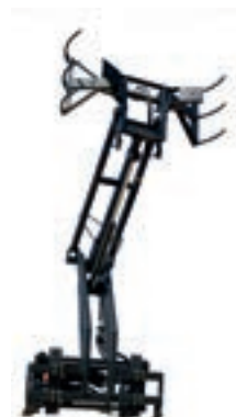
V 60 2,3