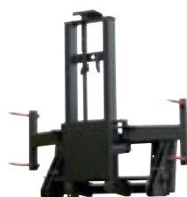
V 50 1,3