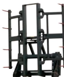
V 500 1