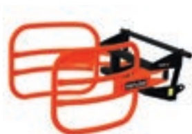
C 30 1